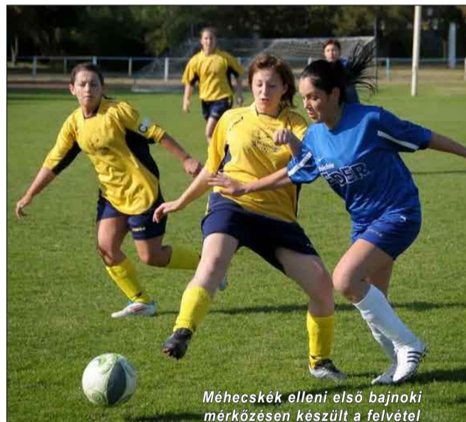
Méhecskék elleni első bajnoki mérkőzésen készült a felvétele!