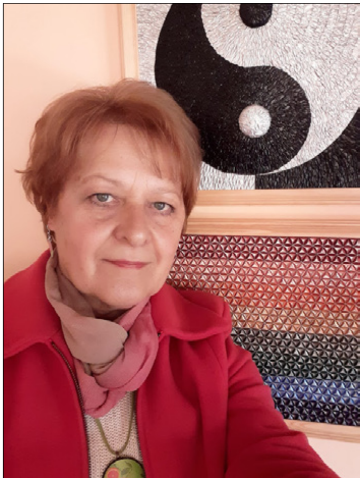
2. "Jin-Jang" A kép 39x39 cm, 240 db. kapszulából kivágott 1200 kör elemből áll. A „Szivárvány” A kép 35x44 cm, 278 db. kapszulából kivágott 1395 kör elemből áll.