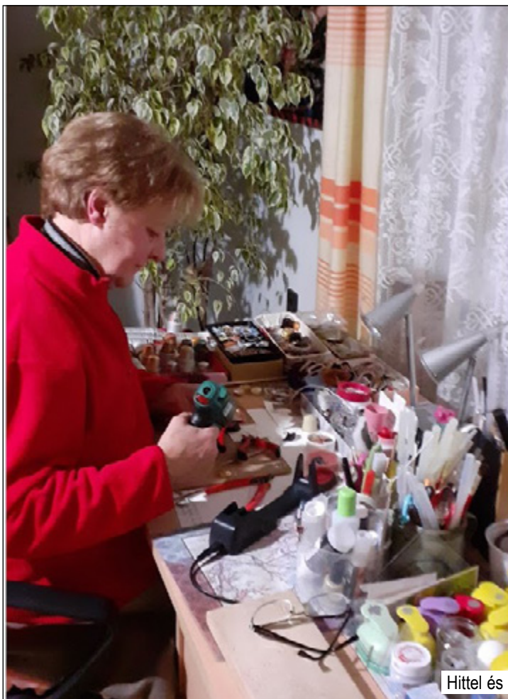
Hittel és szeretettel