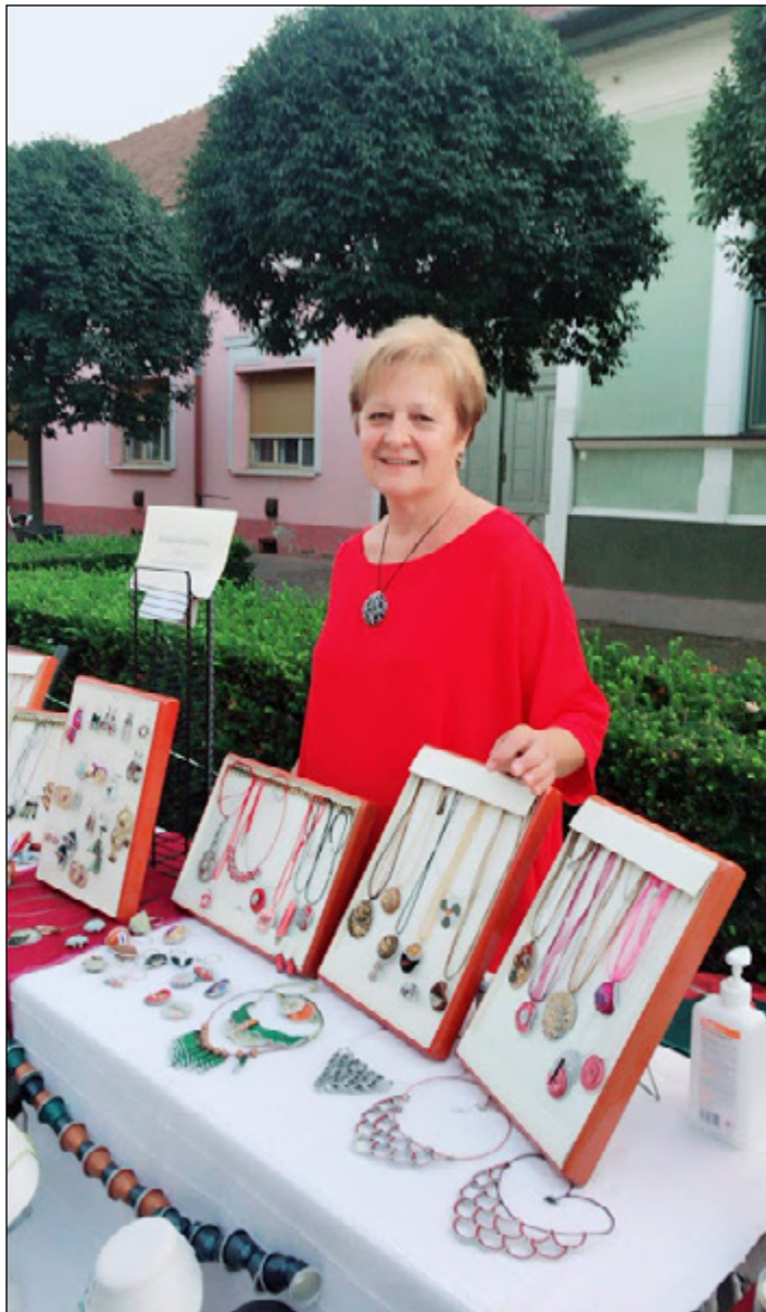
4. Kézművesek vására – Jánoshalmi Napok 2020

— Biztos vagyok benne, legalább is hinni szeretném, hogy a jelenlegi járvány után sok emberben átértékelődnek a dolgok, és ha csak egy kicsit is jobban megbecsüljük a mai világunkat, bizonyára jobban is vigyázunk rá!