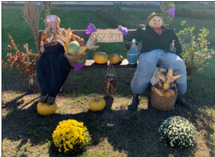
Egy kis vidámság az őszi szürke napokra.