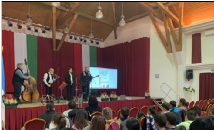
Január: a Magyar Kultúra napja

Ha nem is tudtunk minden rendezvényt hagyományosan megtartani, azért nem mondtunk le teljesen róluk. Az éves beszámolókból látható, hogy sok szép régi kezdeményezés megvalósult, sőt! újak is, amiket reméljük, a jövőben folytatni tudunk majd. Az összetartozásnak, a közösségi találkozásnak különleges szerepe volt, és a város támogató segítsége sem jött rosszkor