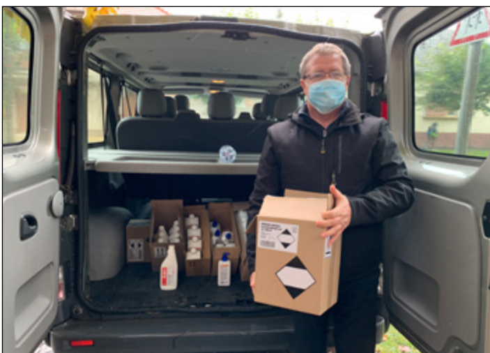
Rendszeresen érkeztek Kormányhivatali csomagok az önkormányzat óvodájába