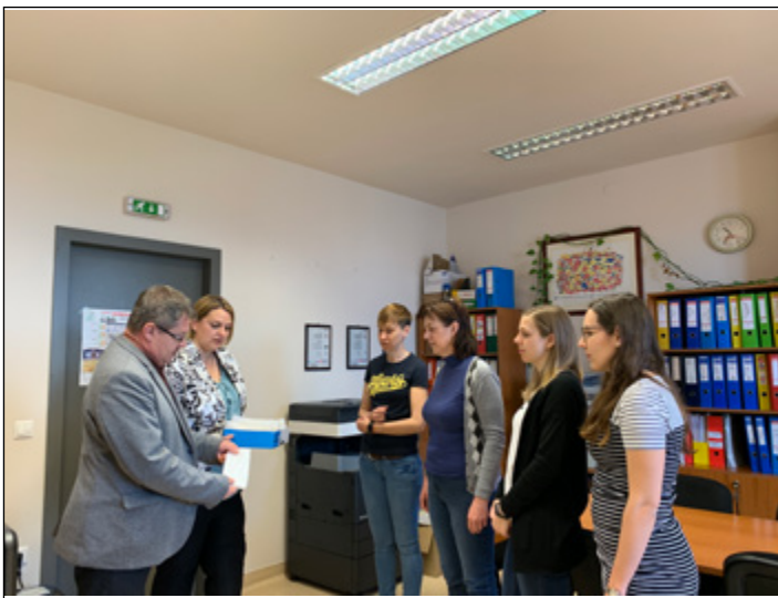
Áprilisban elsőnek az egészségügyi dolgozók kaptak a maszkokból