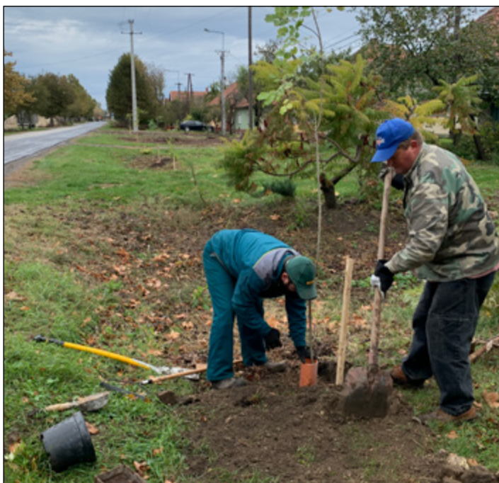
Fák ültetése, kivágott fák pótlása.