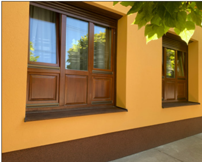
Szeptemberre felújított központi óvoda.