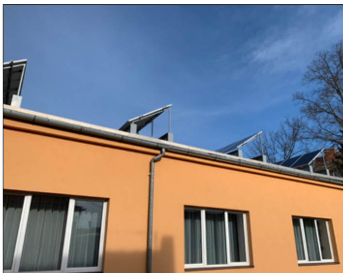
Február Polgármesteri Hivatal megújuló energia napkollektorok felszerelése