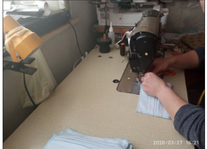
Maszkot varrónő munkában