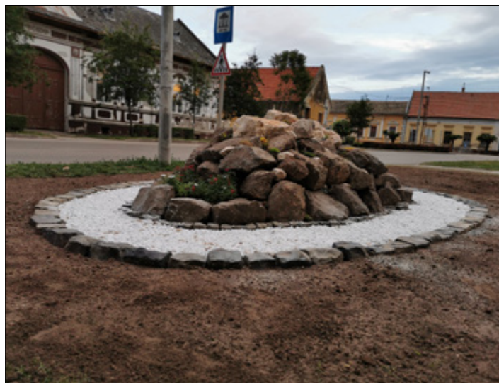
Az új sziklakert a Rákóczi utca elején.