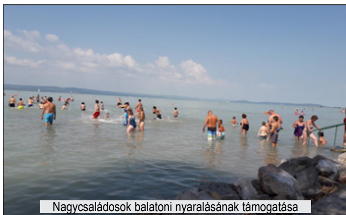
Nagycsaládosok balatoni nyaralásának támogatása