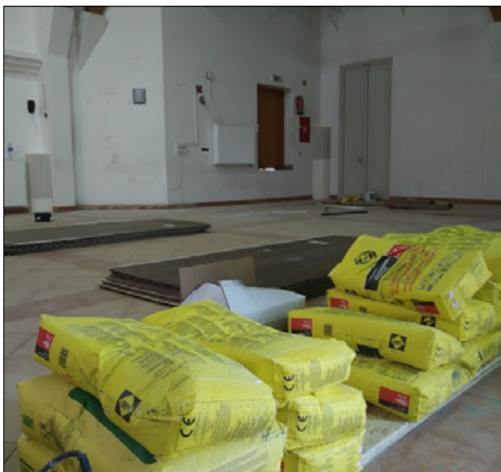
Az Imre Zoltán Művelődési Központ és Könyvtárban tisztasági festése lambériázás