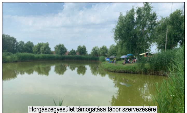
Horgászszervezet támogatása tábor szervezésére