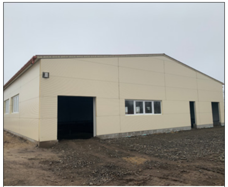
December derekára álltak a gyümölcsfeldolgozó falai