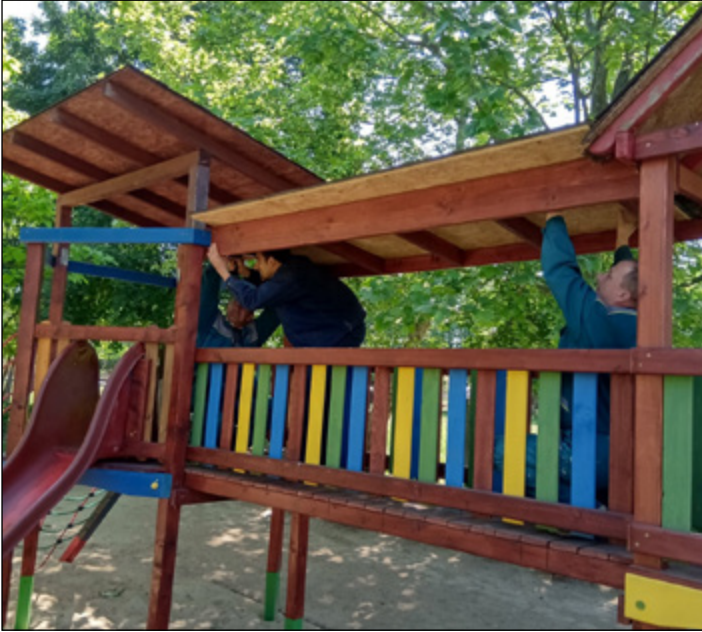
Óvodai udvari játékok éves karbantartása megtörtént.