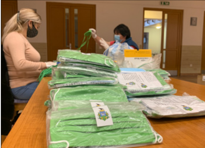
Az egyszer használatos és textilmaszkok minden háztartásba eljutottak tavasszal és ősszel is