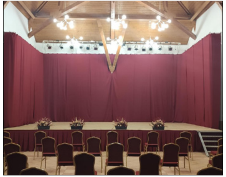
A nyári hónapokban megújult Imre Zoltán Művelődési Központ.