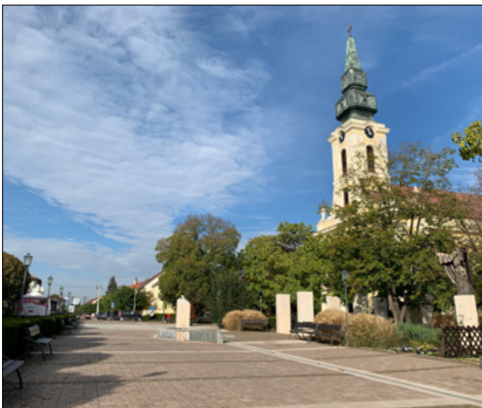
Kiépült a város több pontján az Ingyen WIFI