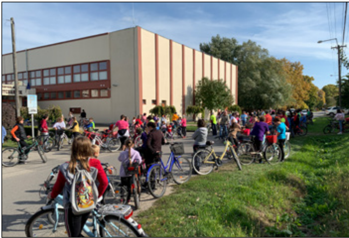
Pörögj Jánoshalma nagy sikerű kerékpártúra