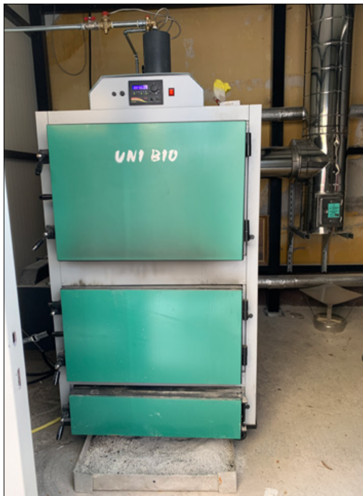
Új kazán, radiátorok, folyosók, irodák kimeszelése, lapos tetőre napelem