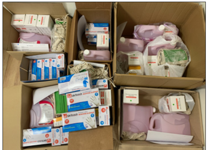
Az Önkormányzat által összeállított egészségügyi csomagok az intézményekbe