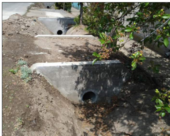
Április: a város déli részén csapadékvíz-elvezető árkok felújítása