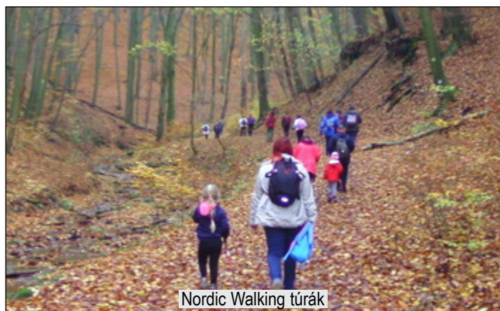
Nordic Walking túrák