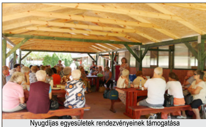
Nyugdíjas egyesületek rendezvényeinek támogatása