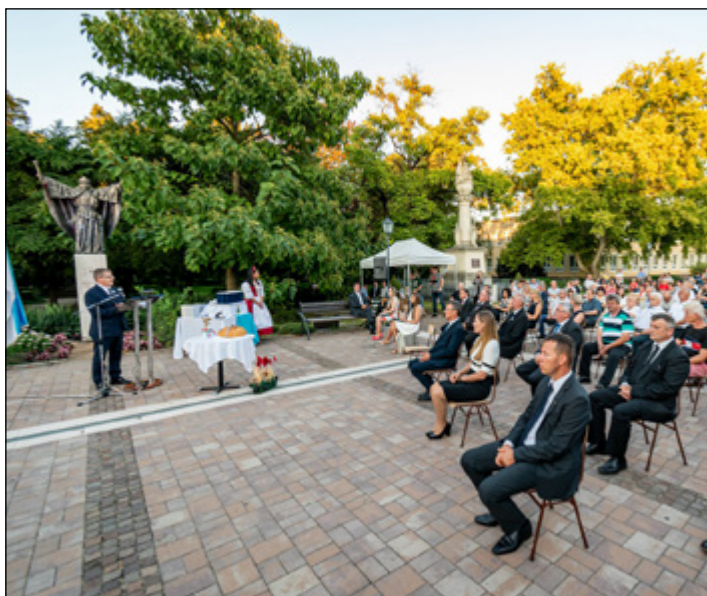
Városi ünnepség a Főtér augusztus 20-án