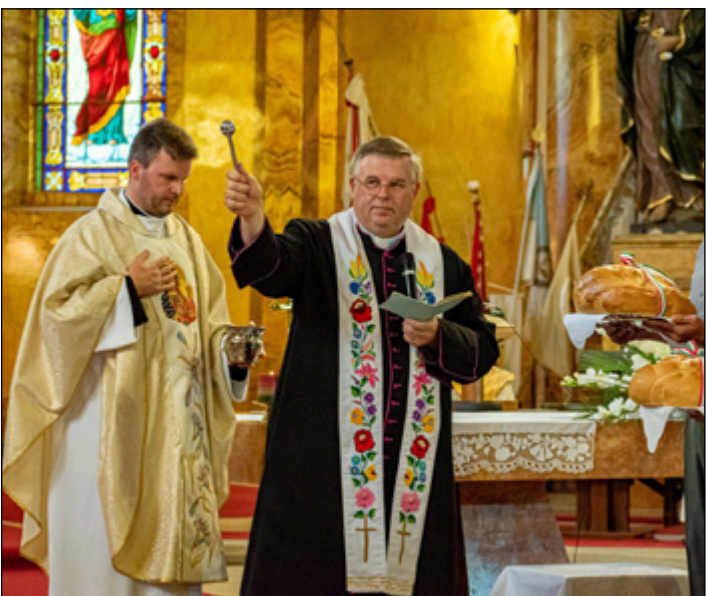
Szent. István ünnepi szentmise augusztus 20-án