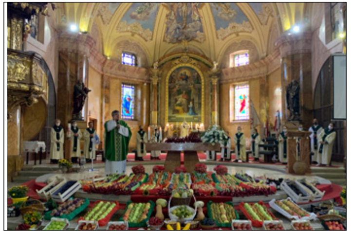
Szüreti napok szeptember: terményáldás a templomban