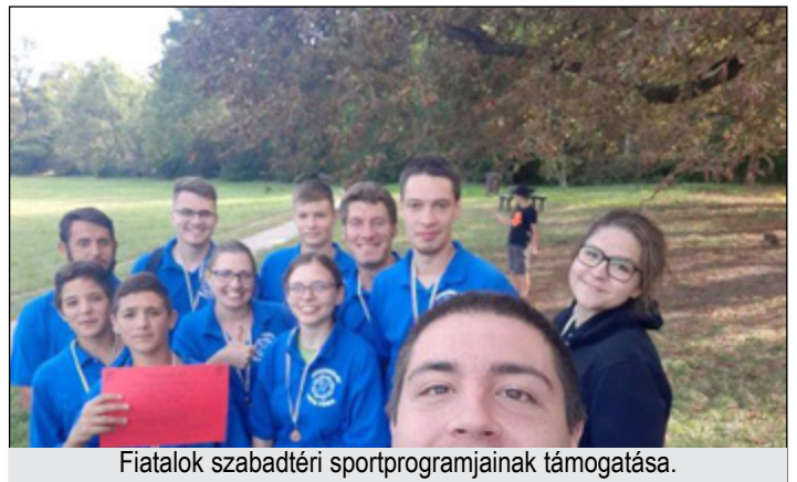
Fiatalklub szabadtéri sportprogramjainak támogatása.