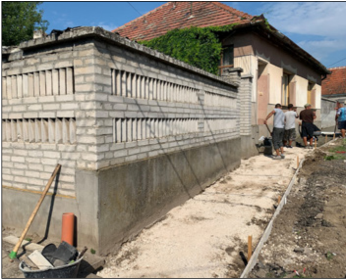
Új járdák a járdaépítési programból