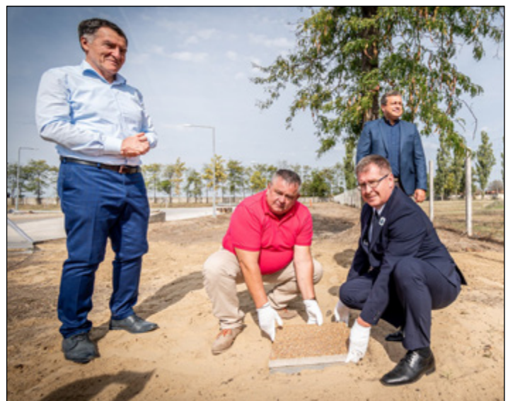
Szeptemberben volt a gyümölcsfeldolgozó alapkövetétele.