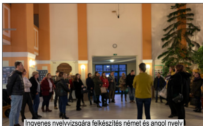
Ingyenes nyelvvizsgára felkészítés német és angol nyelven