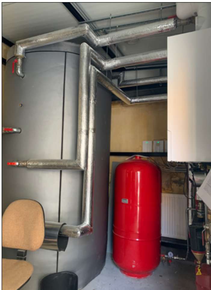
Február: Polgármesteri Hivatal felújítás

A városban megkezdett fejlesztések a vírushelyzet idején nem álltak meg, a tervezett beruházások, és felújítások sem maradtak el. Igaz, hogy nehezebben haladtak, és haladnak ma is, de ez nem meglepő, mivel megnehezített körülmények között minden munkához nagyobb kitérés kell. A Hűtőház, a Gyümölcsfeldolgozó, a felújított Óvoda, az új Bölcsőde viszont mindannyiunk öröme lesz, amikor elkészül. Ha készen lesznek, már nem gondolunk vissza a nehézségekre.