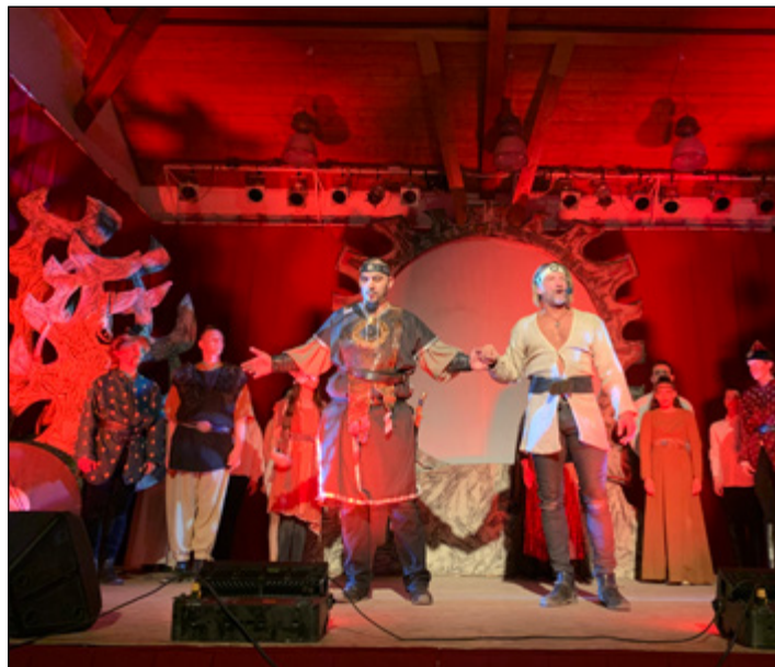
Az utolsó színházi előadás a Covid helyzet előtt, március 11-én.