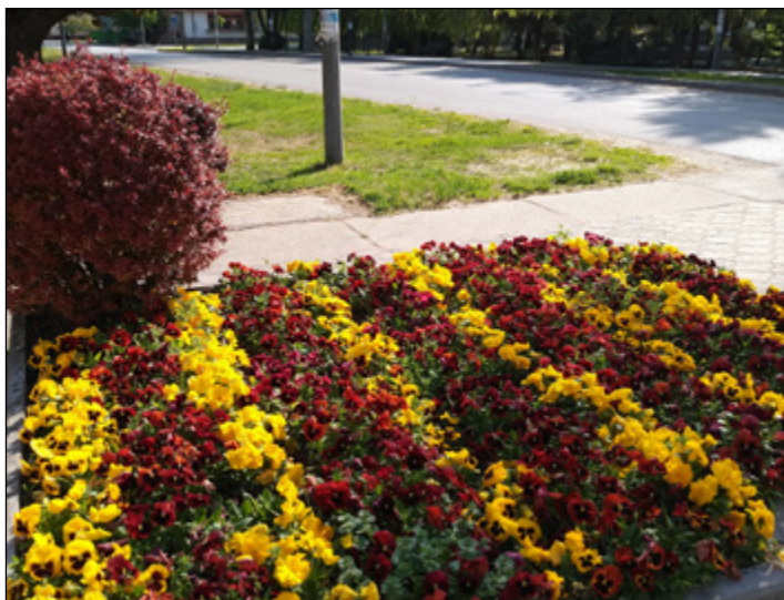
Színpompás virágágyások dicsérik a parkos asszonyok munkáját.