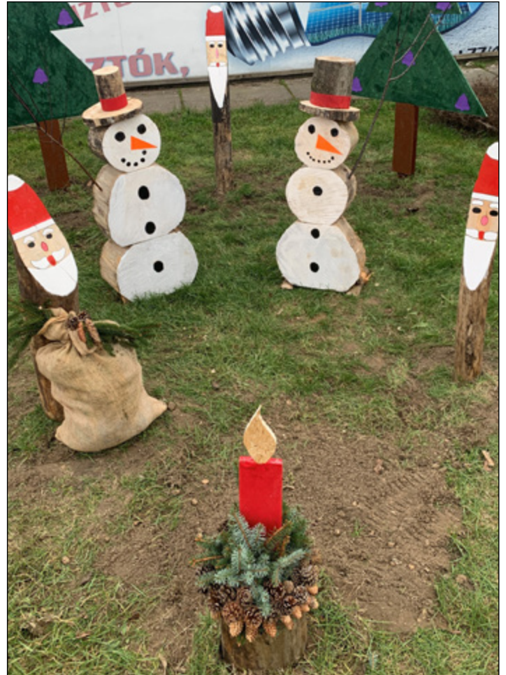
Decemberben megjött a Mikulás

Köszönet a szociális és egészségügyi munkatársaknak, a Családsegítő Szolgálat, és a Városgazda Kft. munkatársainak, a városi oktatásban, a közművelődésben, a hivatalokban, az iparban, a szolgáltató szektorban, a kereskedelemben és a mezőgazdaságban, a közbiztonság területén dolgozóknak az egész éves helytállásukért.