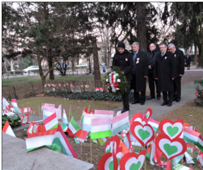
Március 15-dikei koszorúzás a „maradj otthon jegyében”