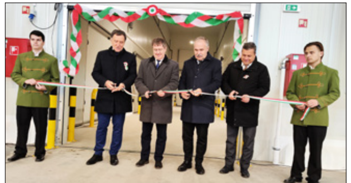
Az új hűtőház az ünnepélyes szalagátvágással került hivatalosan átadásra a felhasználók számára.